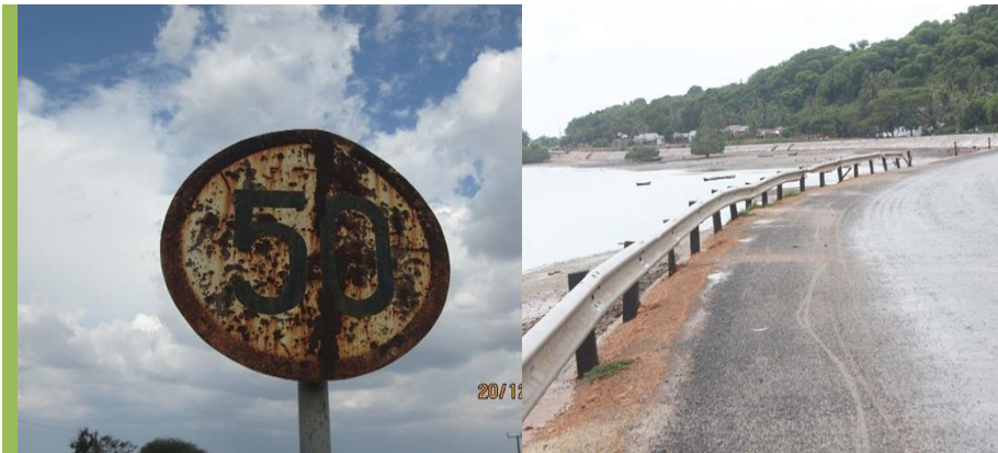
Picha 3.2a: Alama ya mwanzo wa mwendo wa kilomita 50 kwa saa imeliwa na kutu. Picha ilipigwa na wakaguzi maeneo ya Chimala, barabara ya Igawa, Mbeya (TANZAM) tarehe 20/12/2016