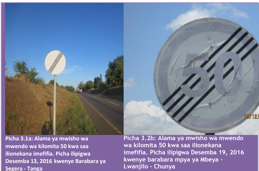
Picha 3.1a: Alama ya mwisho wa mwendo wa kilomita 50 kwa saa ilionekana imefifia. Picha ilipigwa Desemba 13, 2016 kwenye Barabara ya Segera - Tanga